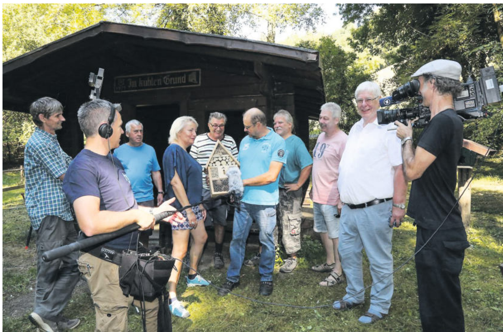
Ein Fernsehteam in Nieder-Liebersbach: Der Birkenauer Ortsteil ist am Samstagabend, 28. Juli, in der Hessenschau zu sehen.