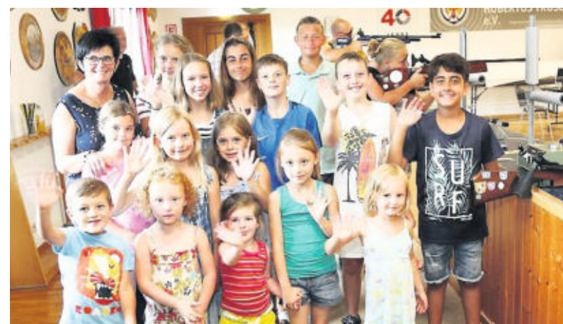
Kleine Schützen: An den Ferienspielen der Gemeinde Gorxheimertal beteiligte sich auch der SV Hubertus Trösel.